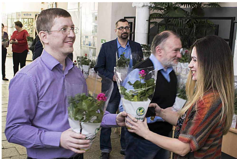
По традиции, у входа в актовyy зал перед началом праздничной программы мужчины вручают цветы

6 марта в университете поздравили преподавателей и сотрудниц с Международным женским днем 8 марта. Коллектив университета большой, в нем работают более двухсот женщин. По традиции, каждой из них в честь праздника полагается скромный, но приятный подарок – весенние цветы, которые мужчины вручают перед началом праздничной программы у входа в актовyy зал.