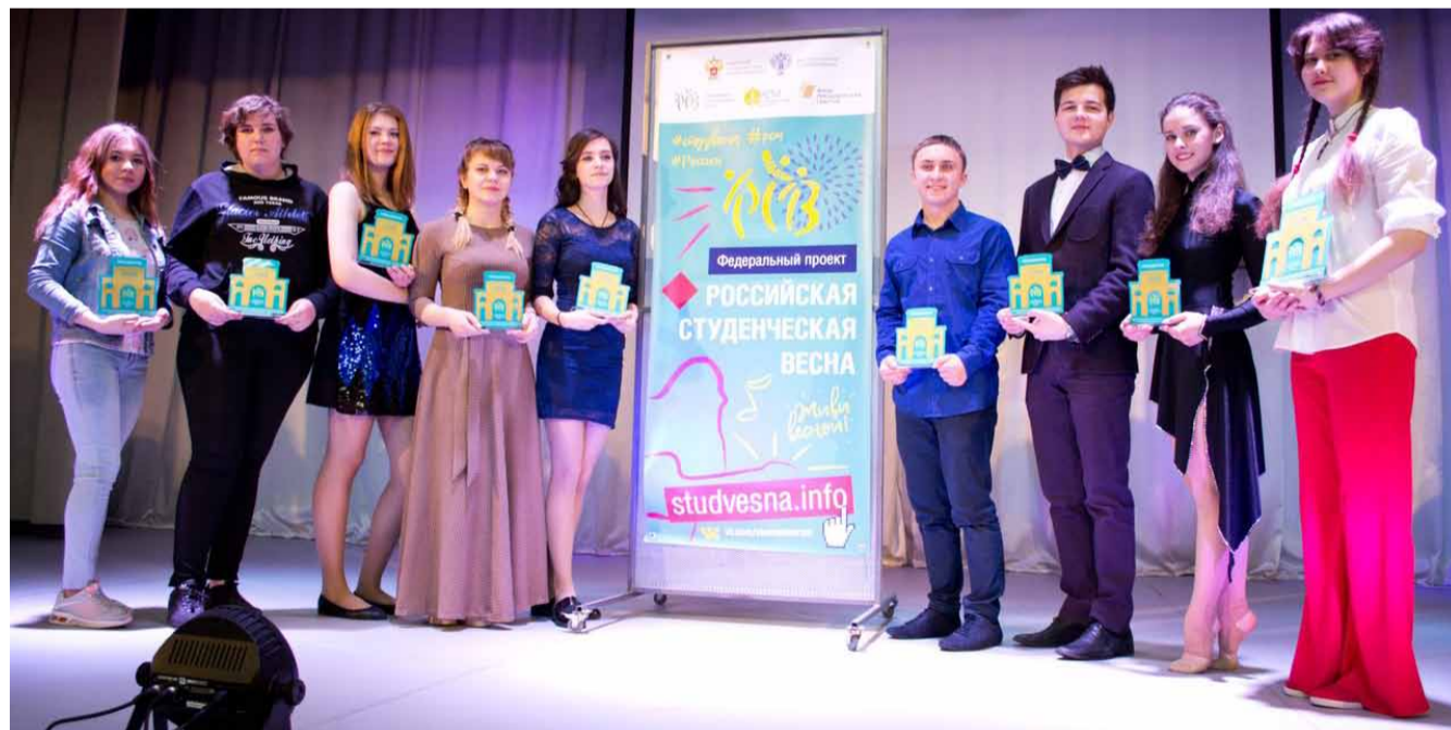
Победители сценических конкурсов фестиваля «Студенческая весна»