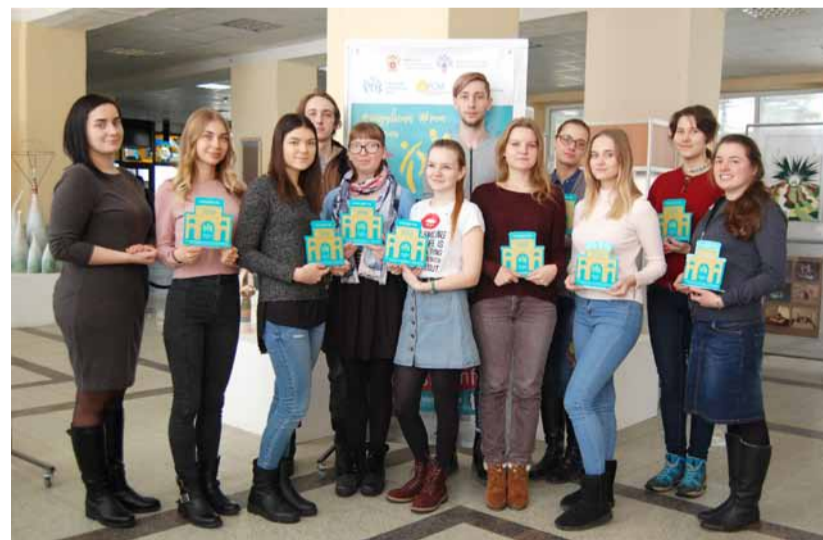
Победители конкурсов в номинациях «Декоративно-прикладное искусство» и «Дизайн-проекты»

Университет вышел с предложением к организаторам областного фестиваля включить номинации «Декоративно-прикладное творчество» и «Дизайн-проекты» в конкурсную программу и проводить выставки студенческих работ, которые могут стать площадкой для обмена опытом и общения творческой молодежи.