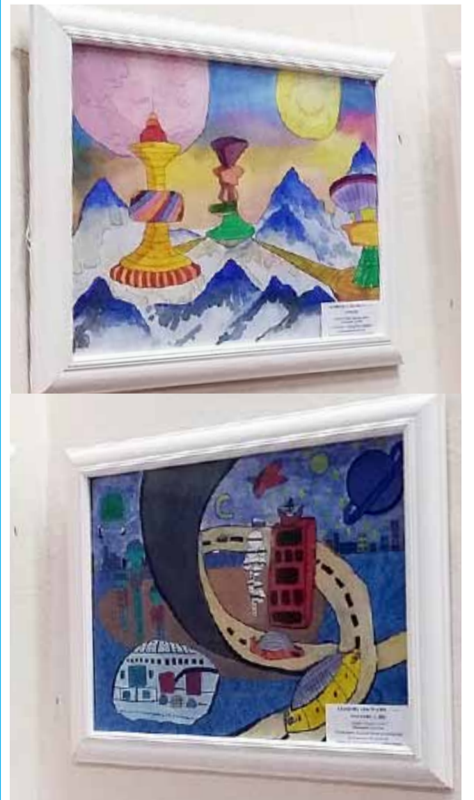
Работы учеников художественной школы №3 на выставке