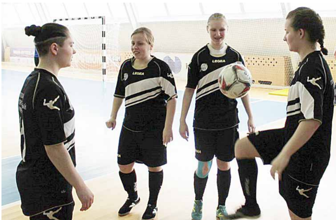
Разминка перед матчем

В первый день разыгралась путевка в финальную часть соревнований. В первом матче с командой из Мытищ наши футболисты сыграли вничью. Встреча закончилась со счетом 4:4. Далее за место в финале пришлось сразиться со спортсменами из Ко-