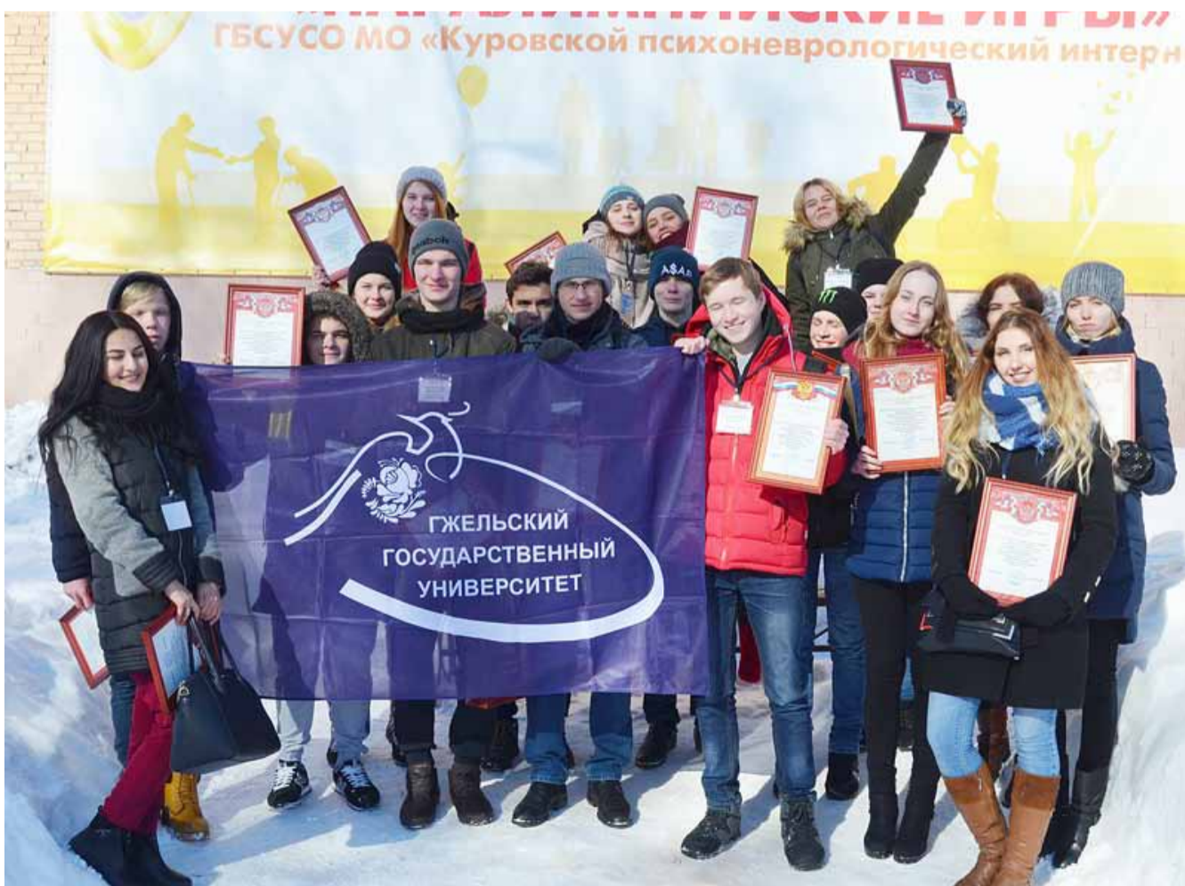
Студенты Гжельского университета приняли участие в проведении зимних областных Паралимпийских игр среди команд стационарных учреждений социального обслуживания