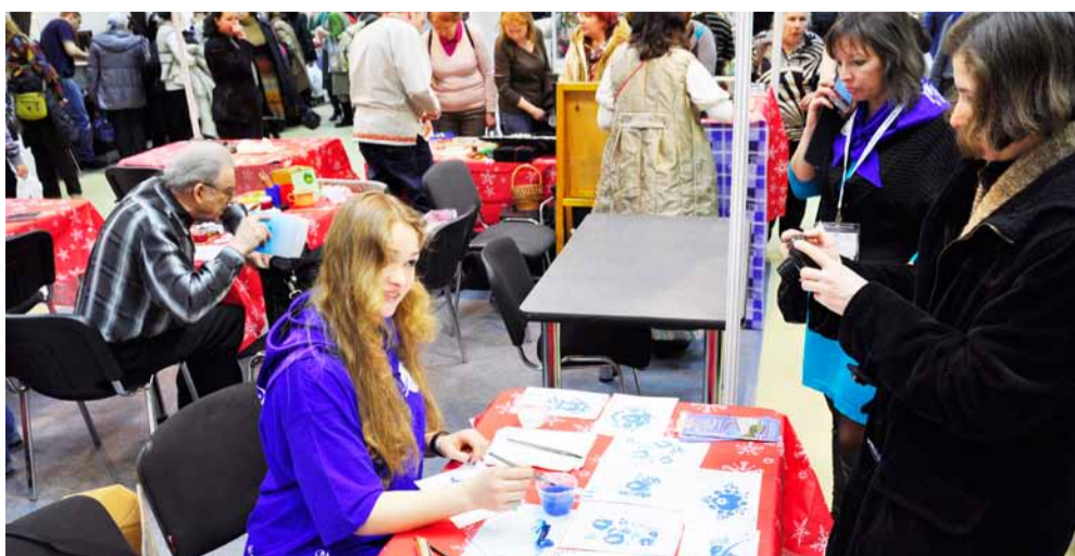
Мастер-класс по гжельской росписи, который проводили студенты ГГХПИ

второй курс факультета декоративно-прикладного искусства