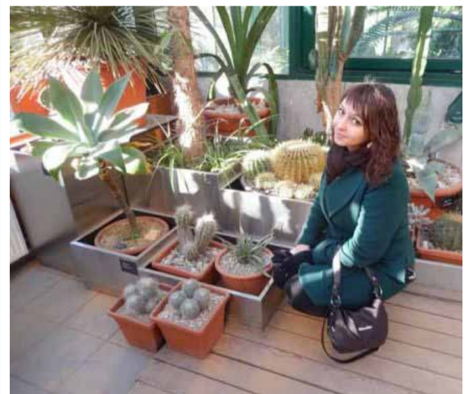
На выставке «Растения засушливых областей Земли»

Можно погулять в Пальмовой оранжерее, где среди вековых пальм, огромных бананов и мощных тропических лиан растут самые редкие и необычные орхидеи со всего света. В фойе оранжерейного комплекса целое подводное царство в больших и маленьких пейзажных аквариумах, за ним можно наблюдать вечно.