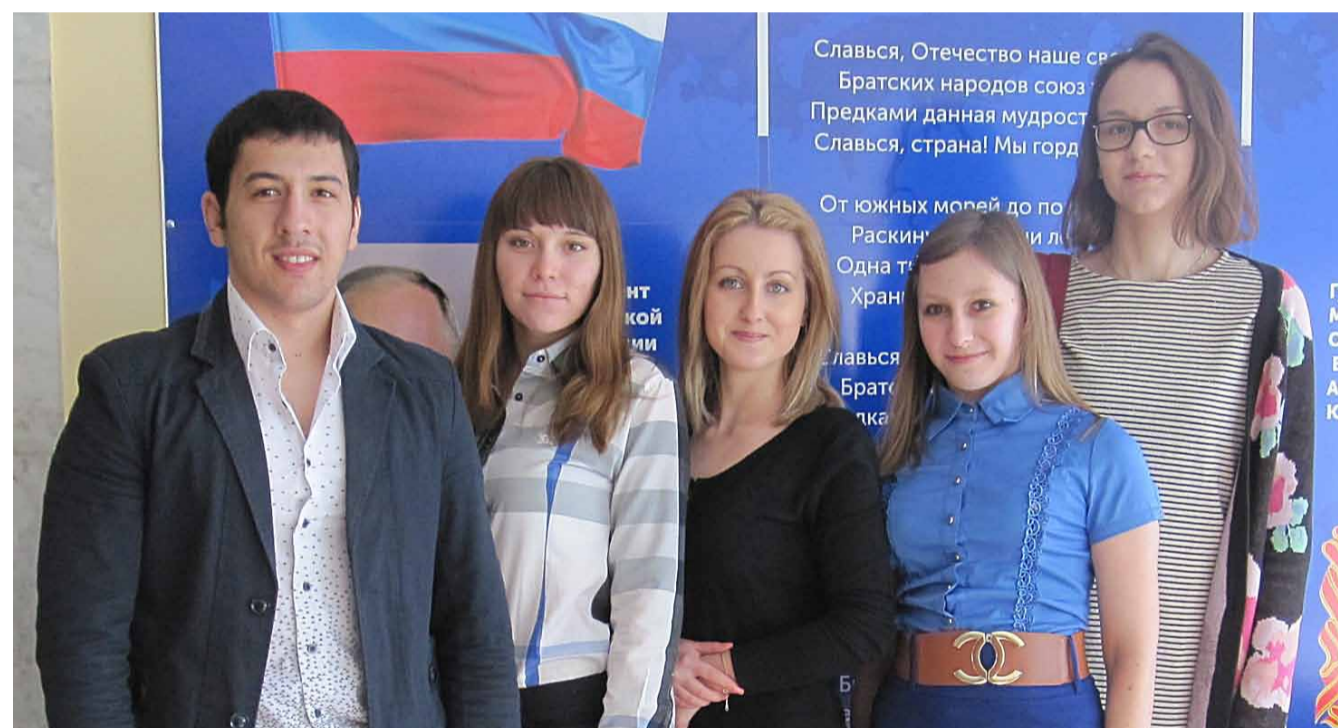
Студенты колледжа ГЖПИ – участники открытой олимпиады профессионального мастерства