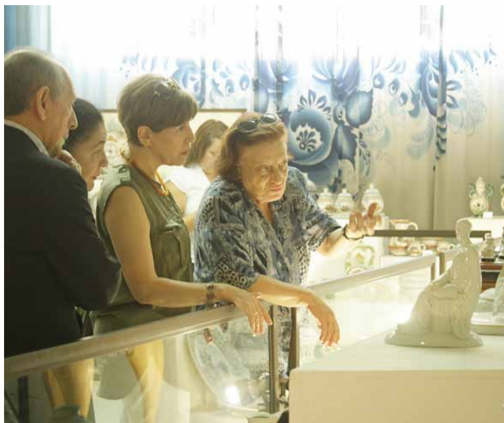
Музей декоративно-прикладного искусства ГЖПИ – одна из жемчужин Гжели

преподаватель факультета сервиса и туризма