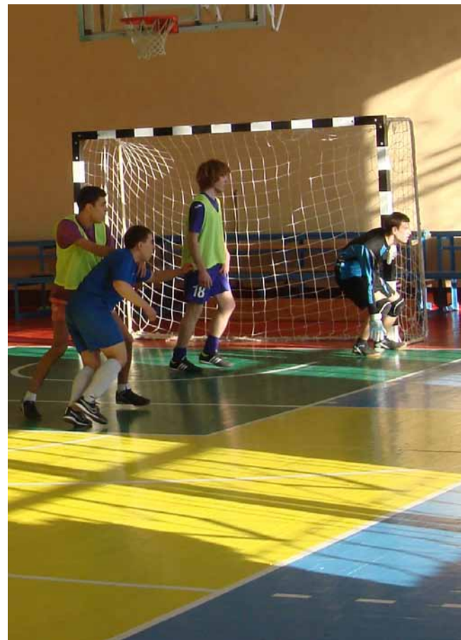
Опасный момент у ворот