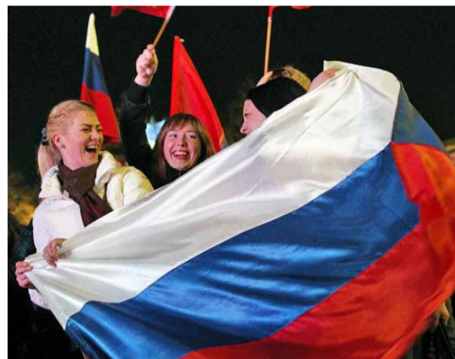
Молодежь празднует присоединение Крыма

ние к России! 21 марта был одобрен и подписан закон, по которому официально состоялось присоединение к России Крыма и Севастополя. В честь этого события в Симферополе устроили грандиозный концерт, на котором Сергей Аксенов произнес такие важные для крымчан слова: «Крым вернулся домой!»