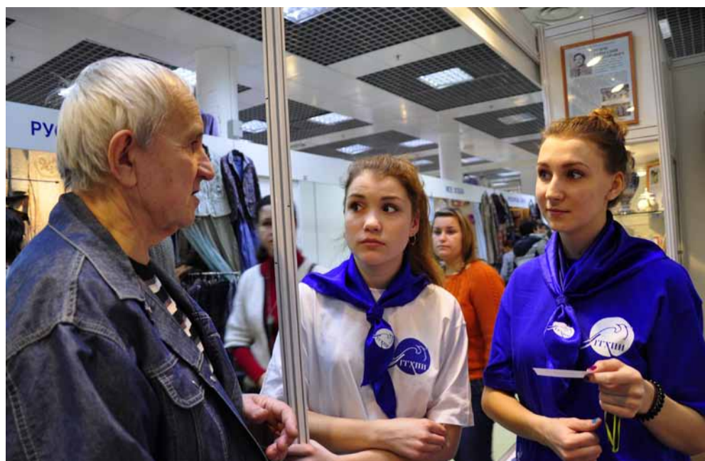
Студентки ГХПИ встречают участников выставки