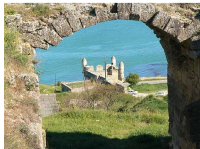
Памятники архитектуры привлекают в Крым ученых