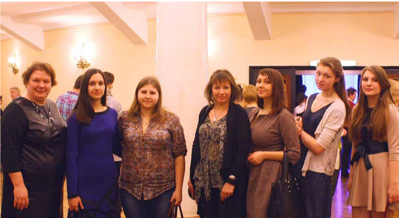
Студенты и преподаватели ГГХПИ в зале имени П.И. Чайковского

11 марта студенты и преподаватели ГГХПИ побывали на концерте Московского академического ансамбля народного танца под управлением Игоря Моисеева в Концертном зале им. П.И. Чайковского.