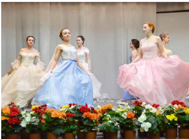
Весенний вальс исполняет студия бального танца «Глория»