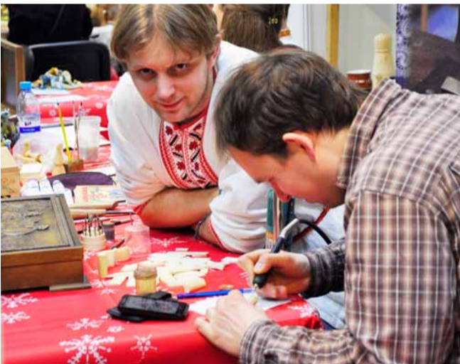
На «Ладье» можно еще и учиться

Выставка-ярмарка «Ладья» проводится дважды в год. В декабре можно побывать на «Зимней сказке», а в преддверии самого цветущего и романтического времени проходит «Весенняя фантазия».