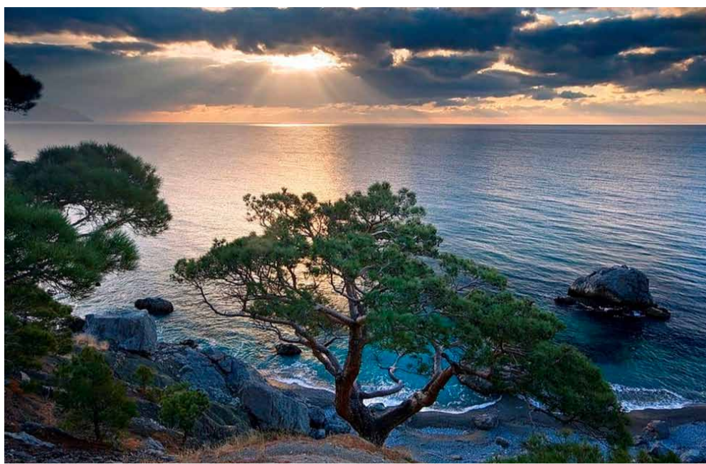
Море и скалы

При прежней власти Крыму было определено место здравницы, но для развития этого направления экономики почему-то особых усилий не никто не прилагал. Хочется верить, что теперь, когда Крым вошел в состав России, положение изменится, что в республике будет развиваться курортный бизнес и значительные средства пойдут на развитие социальной инфраструктуры.