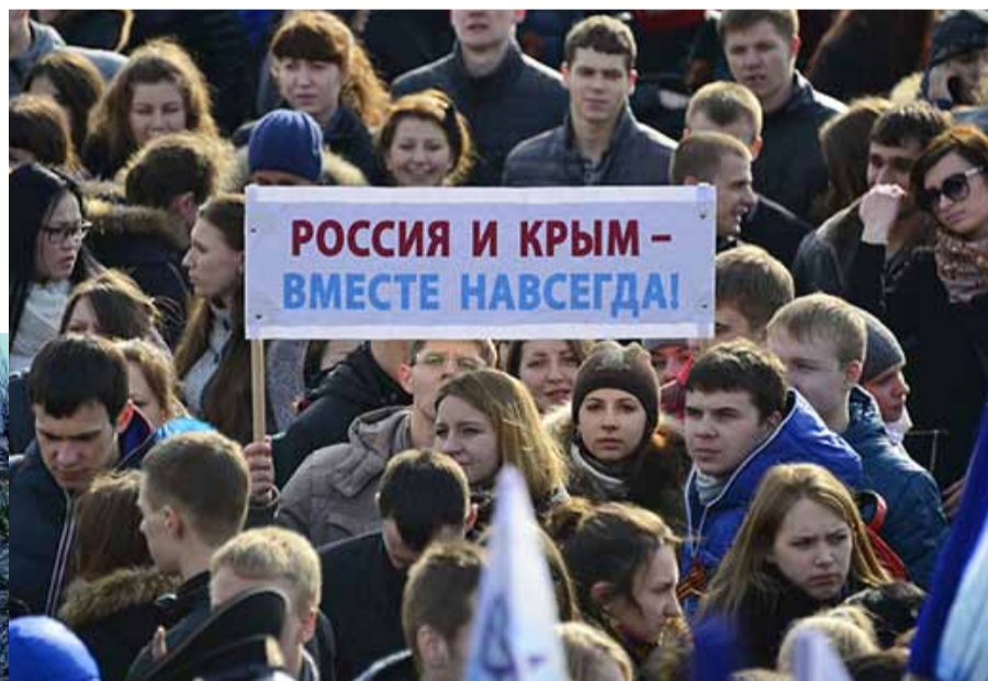
Это был общий